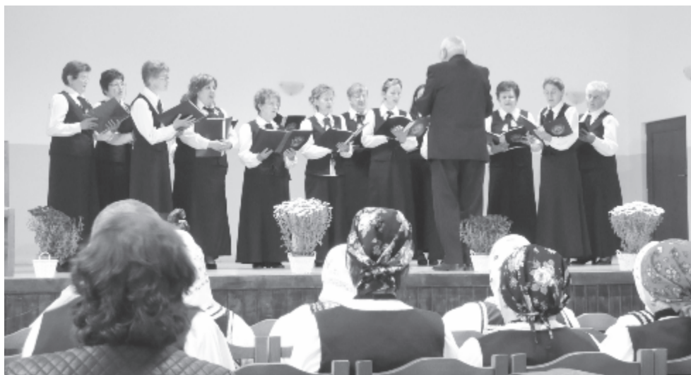
A rendezvényen hat kórus lépett színpadra