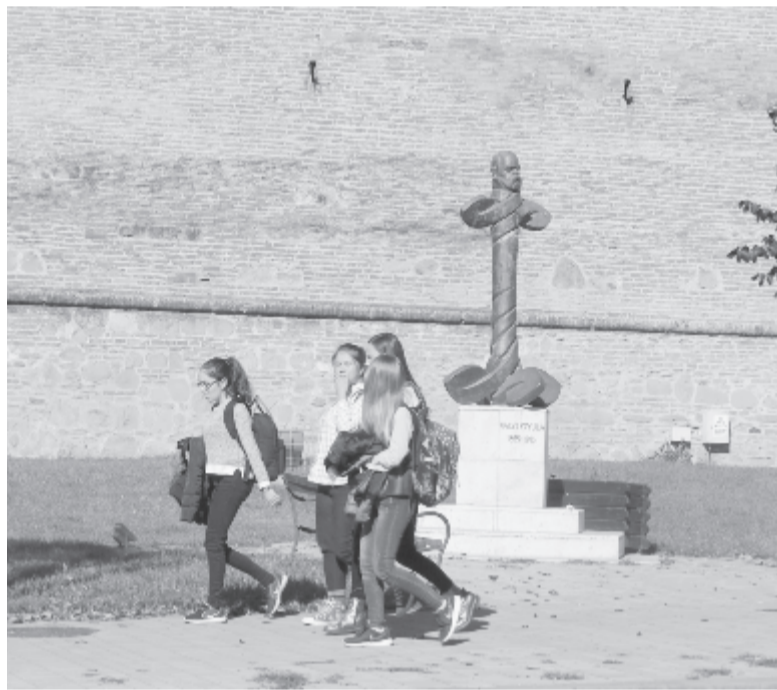
Vályi Gyula szobra Marosvásárhelyen, a vár északi fala mellett

Október 8-án, hétfőn ismeretlen tettesek betörték a mezőcsávási ravatalozó ajtaját. Behatoltak az épületbe, de nem vittek el semmit. Az épület a betöréskor üres volt. Ugyanakkor elvágták a ravatalozótól alig 50 méterre levő – műemlék – harangláb órájának súlyait tartó kötelet. A nehezekeket már nem tudták elvinni a helyszínről, egyéb kárt nem okoztak. Az egyháziak értesítették a rendőrköt, akik a helyszínen ujjlenyomatot vettek, egyelőre ismeretlen tettes után nyomoznak.