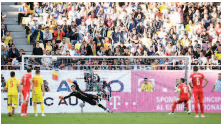
A szerbek legnagyobb gólszerzési lehetősége: a csapatkapitány Dusan Tadic csúnyán elhibázta a 44. percben megítélt büntetőt

Szünet után a szerbek sebességet váltottak, sokat járatták a labdát, és egyik helyzetet a másik után vezették Tătăruşanu kapuja irá-